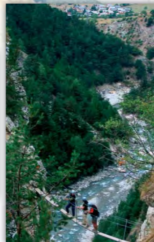
Passerelle de la Vierge