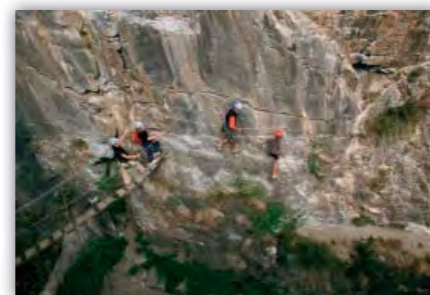
Passerelle des Enfers