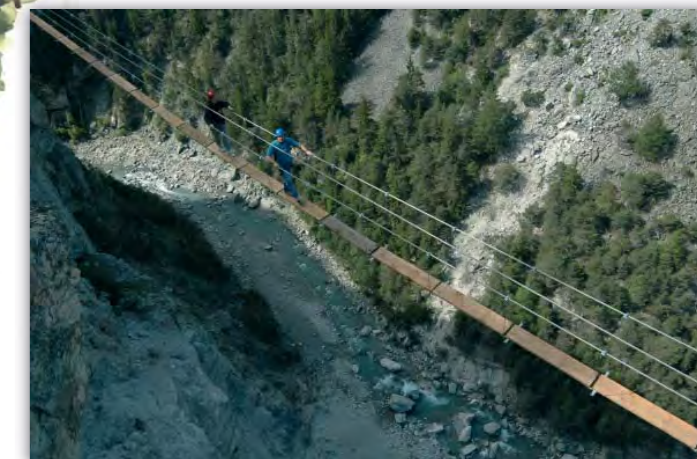
Passerelle Melchior (Rois-Mages)