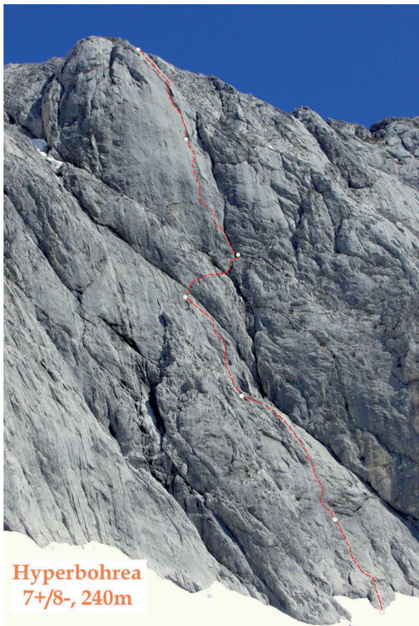
Hyperbohrea 7+/8-, 240m

Abstieg: Westlich am markierten Wanderweg absteigen zur Fleischer-Biwakschachtel und weiter zum „G'hackten“ (versichert, A/B), über das man wieder den Aufstiegsweg erreicht. 2,5-3 Std./1400Hm. Oder besser abseilen (eventuell Standplätze mit Schlingen verstärken).